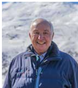
ANDRÉ PLAISANCE, LE PRÉSIDENT